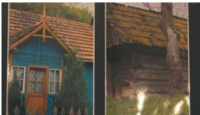
Prace z wystawy „Detal architektoniczny Muszyny”

posiadały jeden wspólny element - wątek miłosny. Koncert odbywał się w formie on-line a wyemitowany został 14 lutego w wieczór walentynkowy kiedy świętowali zakochani. Dziękujemy za liczny udział, polubienia i udostępnienia koncertu.