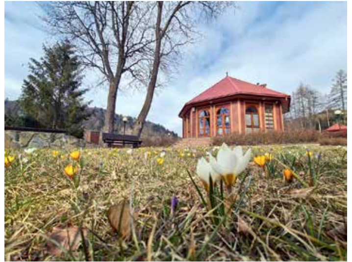
Pierwsze krokusy w Ogradach Magicznych