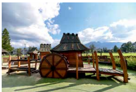
Zdjęcie poglądowe FOT. WWW.MIEJSCADZIECI.PL

T rwają prace związane z przygotowaniem konkursu architektonicznego dotyczącego zagospodarowania przestrzeni parkowej nad potokiem Szczawnik. Zostały już uwzględnione wnioski mieszkańców i Komitetu Osiedlowego. Gdyby ktoś z Państwa zechciał wnieść jeszcze swoje uwagi, to istnieje taka możliwość ponieważ jesteśmy w fazie projektowej. (RED)