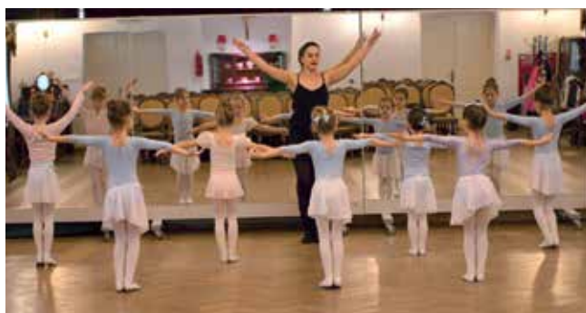
Zajęcia z baletu

Rok 2021 rozpoczęliśmy w muzyńskiej kulturze kolędowo i świątecznie a stało się tak za sprawą I Festiwalu Kolęd i Pastorałek oraz Piosenek o Bożym Narodzeniu „Bóg się rodzi”. Przedsięwzięcie zorganizowane zostało przez Miejsko-Gminny Ośrodek Kultury w Muszynie i spotkało się z ogromnym zainteresowaniem młodych wokalistów z różnych stron Polski. Na przełomie grudnia i stycznia kolędy i pastorałki rozbrzmiewały w Dworze Starostów gdzie jury wyłoniło laureatów konkursu. Wykonawcy