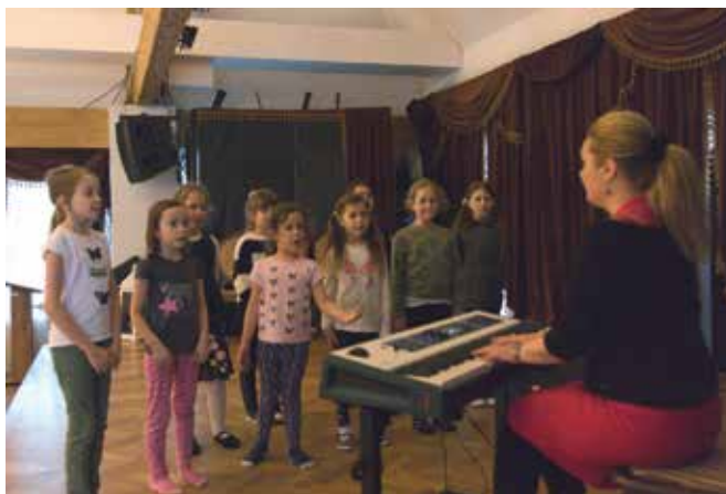
Zajęcia wokalne

„Miłość w Muszyńskich Musicalach” to tytuł koncertu walentynkowego, który zrealizowany został przez Miejsko-Gminny Ośrodek Kultury w Muszynie. W programie znalazły się utwory pochodzące z musicali „Mussina Biskupie Miasteczko”, „Mussina Baśń o Muszynie” oraz „W krainie żywej wody”. Wszystkie piosenki