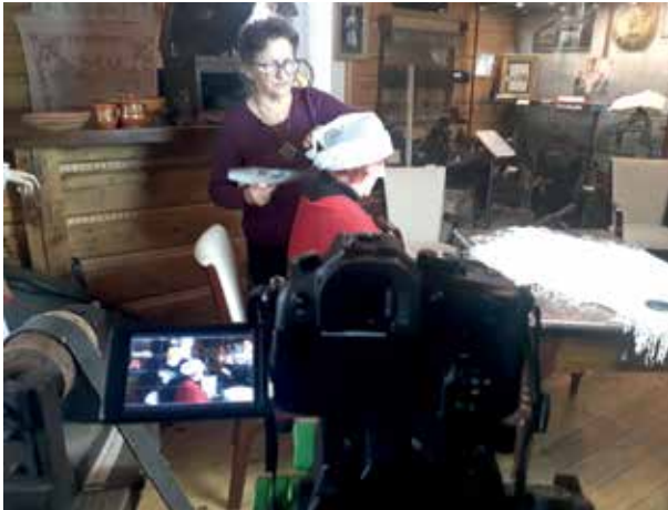
„Jak upinano czepce muszyński mieszczek”