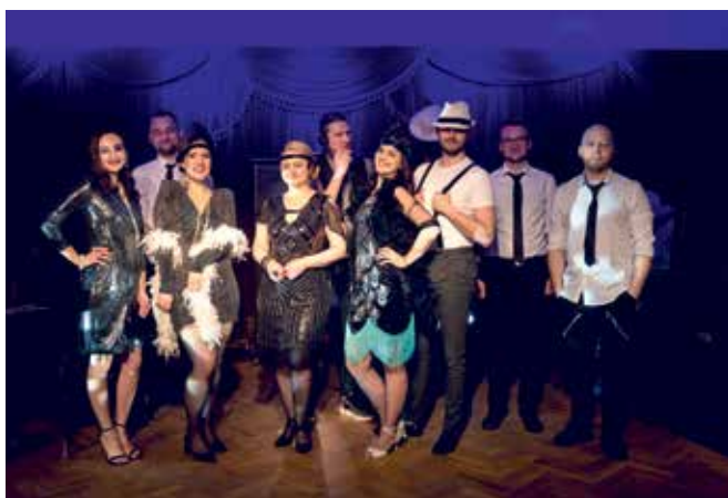
Laurka w Stylu Retro