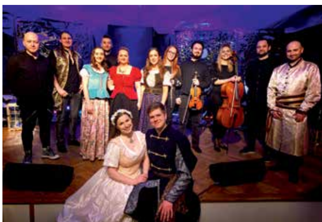
Miłość w Muszyńskich musicalach