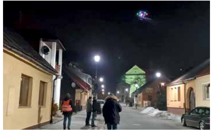
Kontrole z użyciem drona

Bardzo prosimy o przestrzeganie norm jakości stosowanego opału, a przede wszystkim o nie spalanie odpadów. Pamiętajmy o tym, że zdrowie jest najważniejsze. Zgodnie z uchwałą antyśmogową dla