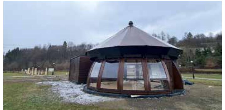
Nowa kawiarnia w Ogradach Magicznych - w trakcie budowy