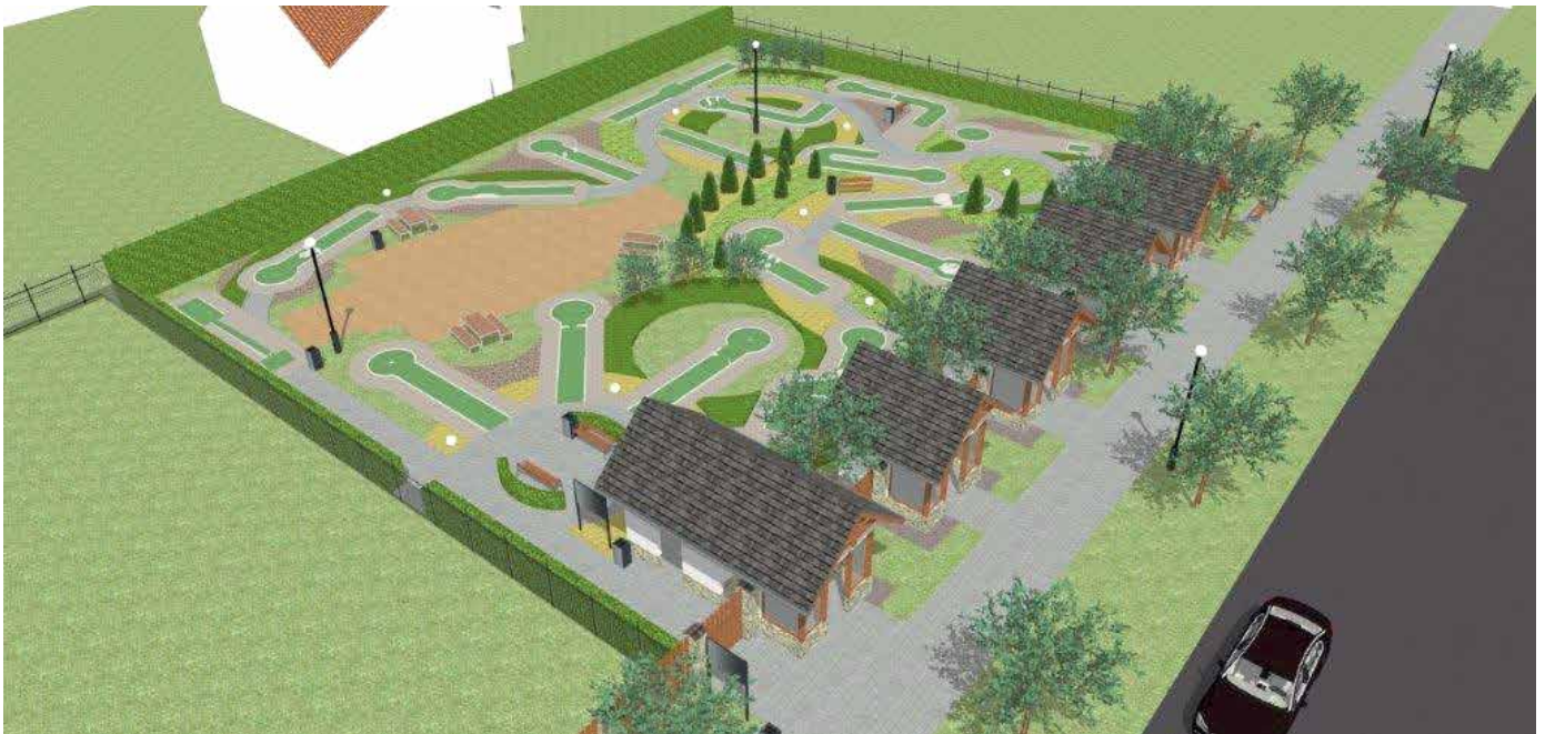
Wizualizacja pola do minigolfa przy basenach na Zapopradziu