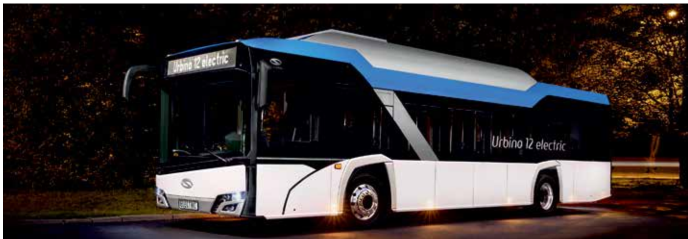
Zdjęcie poglądowe

O d początku roku aż do 31 grudnia 2021 r. realizowane są przewozy autobusowe o charakterze użyteczności publicznej na podstawie umowy z Zarządem Województwa Małopolskiego. Przewozy wykonuje firma RAFATEX na liniach: Wojkowa – Muszyna źr. Wapienne –