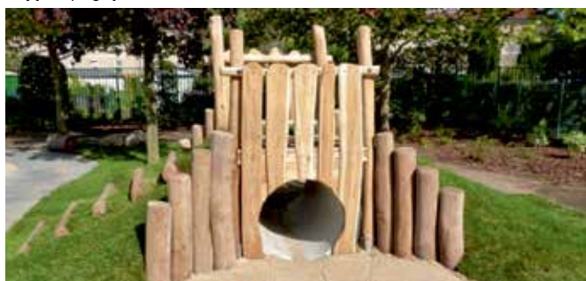
Zdjęcie poglądowe