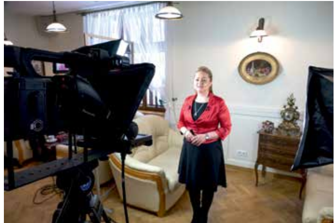
Prace redakcji podczas tworzenia Kroniki Muszyńskiej