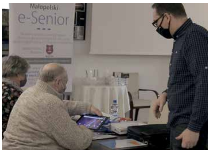
Kurs komputerowy „Małopolski e-senior”