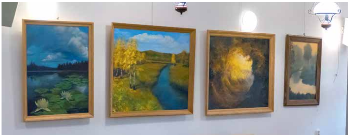
Prace Krzysztofa Opielewicza - wystawa „W moim magicznym świecie”

zwiedzających gości, oczywiście wszystko odbywało się w określonym reżimie sanitarnym, ale do tego jesteśmy już przyzwyczajeni.