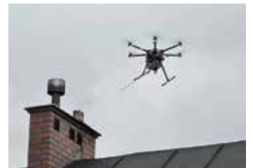
Pomiar dymu z komina