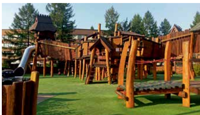
Zdjęcie poglądowe