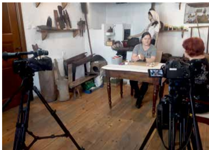
Warsztaty robienia laurki

Z okazji Dnia Zakochanych w Muzeum Regionalnym „Państwa Muszyńskiego” przygotowano dwa interesujące materiały filmowe. Pierwszy z nich dotyczył ślubów mieszczan muszyńskich o których