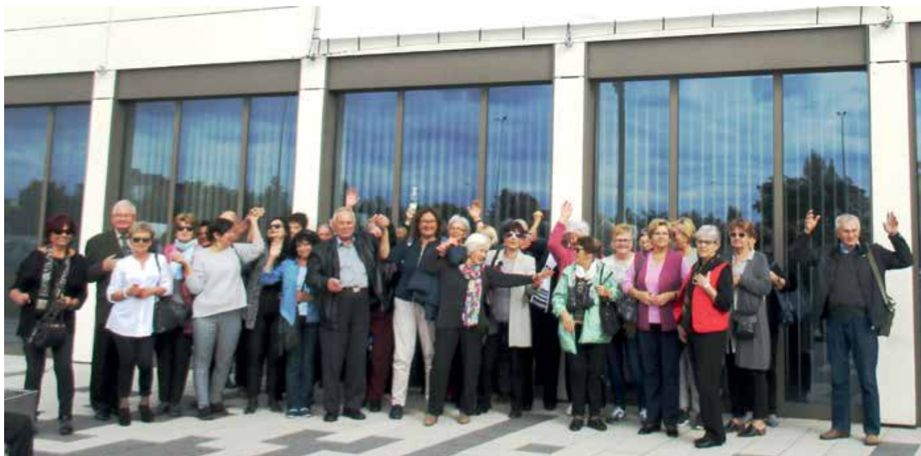
Uzdrowskowska Akademia Seniora