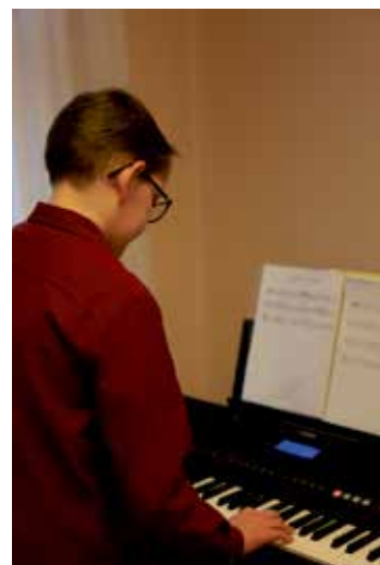
Zajęcia edukacyjne gry na instrumentach

Po długiej przerwie spowodowanej koronawirusem w styczniu tego roku po raz kolejny wznowiono