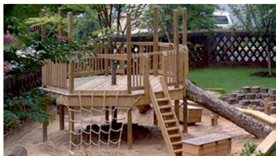
Zdjęcie poglądowe