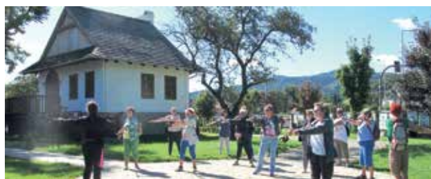
Zajęcia ruchowe dla seniorów

propozycja zajęć w naszym programie i liczymy, że znajdzie ona wielu sympatyków.