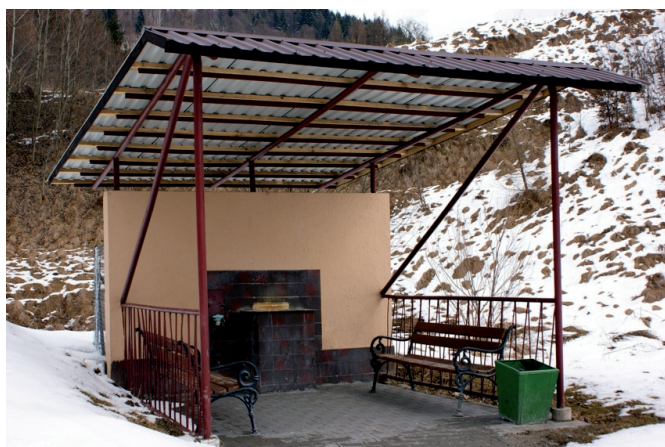
Wyremontowane źródło „Wapienne” w Muszynie