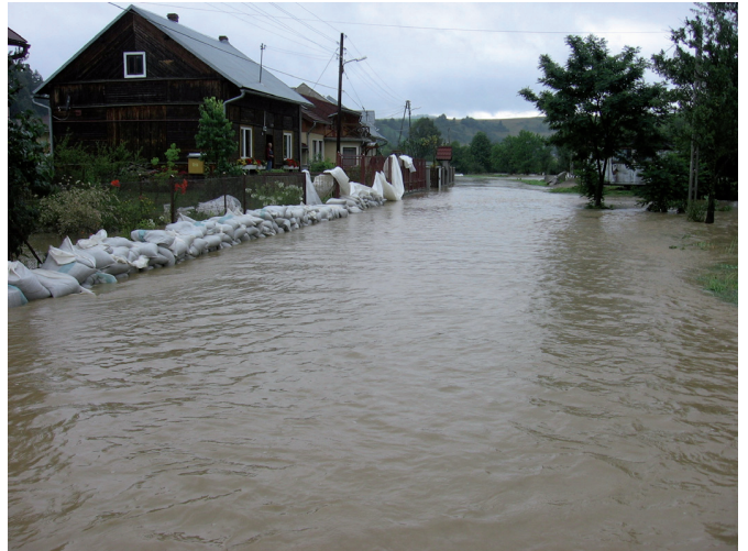
Powodzie na Folwarku dawnej i dziś