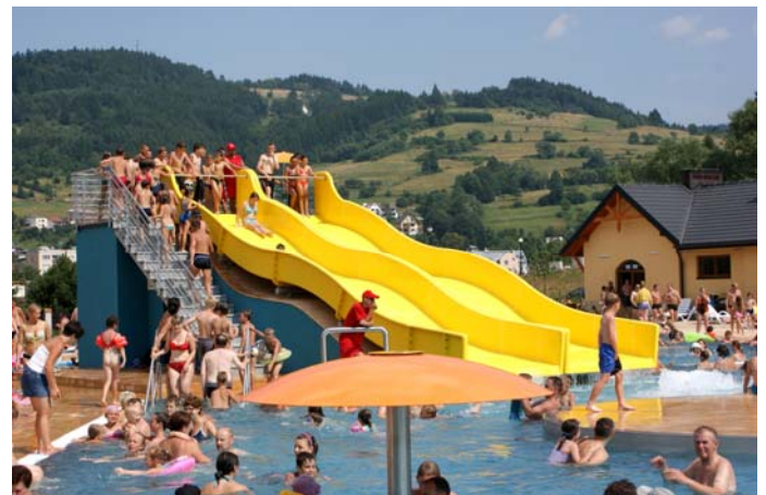
Baseny w Muszynie