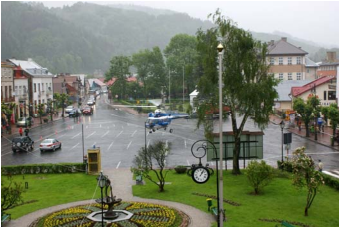
Działania ewakuacyjne z wykorzystaniem śmigłowca

W wyniku czerwcowej powodzi aż 310 rodzin zostało poszkodowanych. Na tę liczbę składają się zarówno rodziny, które poniosły straty w budynku mieszkalnym jak również na posesjach, garażach i budynkach gospodarczych. U wszystkich tych rodzin został spisany protokół szkód.