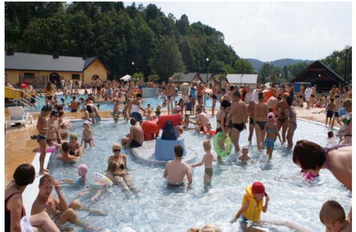
Baseny w Muszynie

W życiu każdego człowieka, - ale też i całych społeczności - są chwile radosne, ale są też i smutne, takie, które chcielibyśmy jak najszybciej wymazać z pamięci.