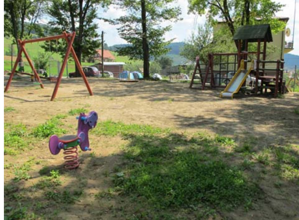
Plac zabaw w Jastrzębiku