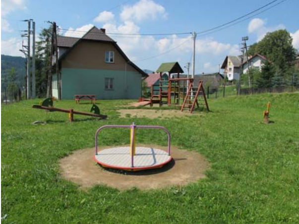
Plac zabaw w Andrzejówce

Młodzież i dzieci w naszej gminie nie mogą narzekać na realizację infrastruktury sportowej i rekreacyjnej. W ostatnim czasie (maj, czerwiec, lipiec) oddano do użytku kilka placów zabaw i obiektów sportowych. Nowy obiekt sportowy z placem zabaw otrzymały: Andrzejówka (obiekt przy szkole), Żegiestów (obiekt przy szkole podstawowej), Jastrzębik (obiekt przy szkole). Na realizację nowych obiektów sportowych i placów zabaw oczekują jeszcze: Powroźnik (boiska przy szkole), Szczawnik, Milik.