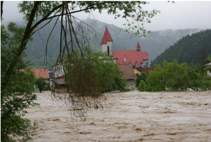
Powódź w Muszynie

SZANOWNI PAŃSTWO! MIESZKAŃCY MIASTA I GMINY UZDROWISKOWEJ MUSZYNA!