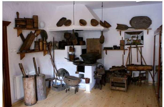
Zajazd w Muszynie