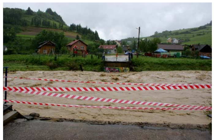
Ul. Polna już bez mostu