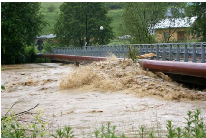
Most na Folwarku