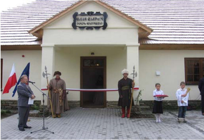
Otwarcie i poświęcenie muzeum