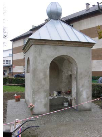
Kapliczka św. Nepomucena