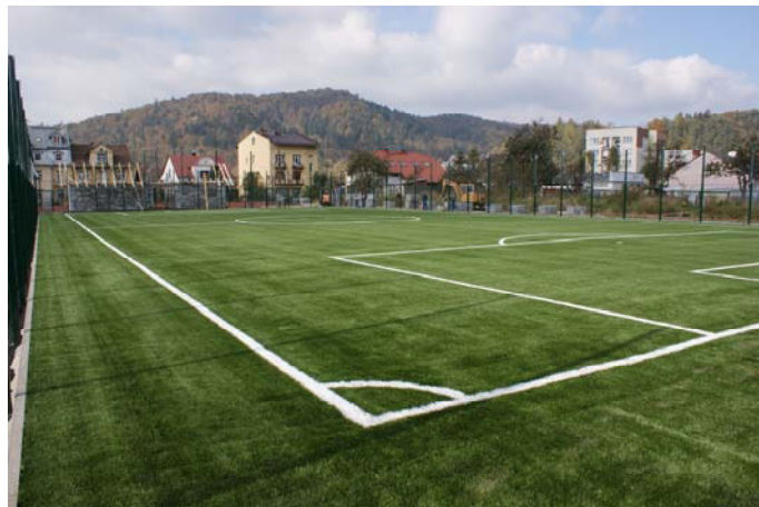
Boisko do piłki nożnej