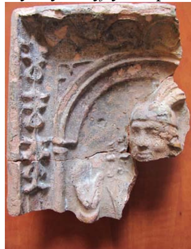
Prace i znaleziska na Baszcie