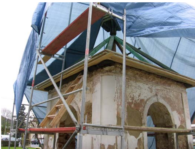
Kapliczka św. Floriana

Trwa również remont zabytkowej kapliczki pw. św. Jana Nepomucena realizowany w całości ze środków własnych Miasta i Gminy Uzdrowskiej Muszyna. Realizowane prace obejmują wykonanie zabezpieczeń przeciwwilgociowych fundamentów i posadzki, renowację tynków wewnętrznych i zewnętrznych, malowanie, czyszczenie i malowanie bramy wejściowej, wykonanie kutego herbu Muszyny, wykonanie nowych okien. Figury świętych, a także same kapliczki zostaną w odpowiedni sposób podświetlone tak, aby wydobyć z nich prawdziwe piękno. Odrestaurowanie kapliczek wiąże się nie tylko z podniesieniem ich estetyki i utwaleniem oraz zachowaniem substancji zabytku, ale też z początkiem prac zmierzających do podniesienia estetyki Rynku. Dzięki przeprowadzeniu tych prac muszyńskie kapliczki i Rynek zyskają nowe oblicze i blask.