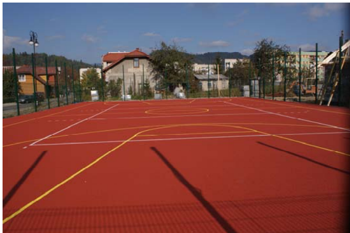
Wielofunkcyjne boisko do koszykówki, siatkówki i tenisa

Marszałkowskiego Województwa Małopolskiego w kwocie 333.000 zł. Resztę kosztów pokrył wkład własny gminy ok. 494.000 zł. Oprócz dwóch boisk projekt przewiduje również infrastrukturę towarzyszącą: chodniki, ogrodzenia oraz budynek socjalny spełniający funkcję sanitarno-szatniowe. Ogólnodostępny kompleks usytuowany przy ul. Piłsudskiego oddany zostanie do użytku w terminie 30 listopada 2010 r. Drugi kompleks planowany jest w Szczawniku, a jego realizacja przewidziana jest w 2011 roku.