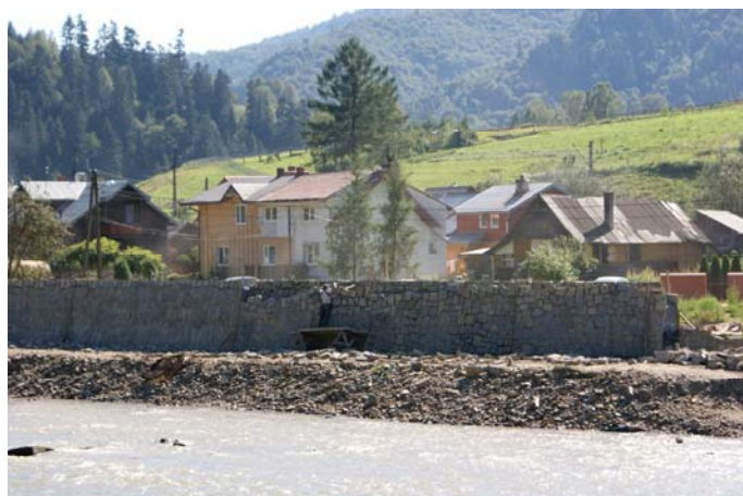
Budowa wałów przeciwpowodziowych