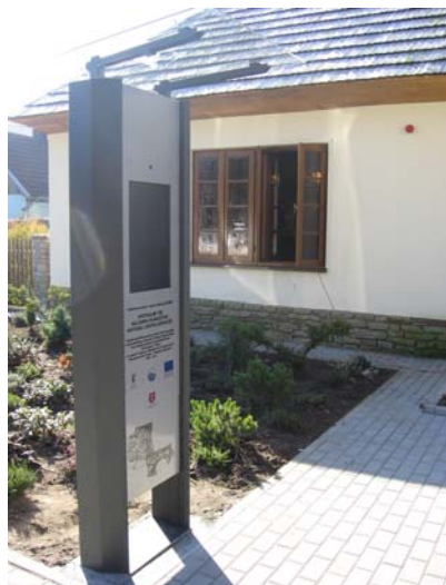
Infokiosk przed muzeum

Listopad 2009 r. oraz 31 lipca 2010 r. to dwie ważne daty w historii nowożytnej naszego regionu. Pierwsza z nich to rozbiórka zabytkowego (XVIII w.) Zajazdu w Muszynie. Druga to uroczyste otwarcie zrekonstruowanego budynku Zajazdu będącego obecnie siedzibą „Muzeum Regionalnego Państwa Muszyńskiego”. Pionierskie przedsięwzięcie w skali całego województwa (do tej pory w Małopolsce nie dokonano przeniesienia i rekonstrukcji murowanego budynku) było częścią większego projektu związanego z budową obwodnicy. W nowym Muzeum oprócz wiedzy historycznej na temat Ziemi Muszyńskiej można również zasięgnąć informacji turystycznej oraz wiadomości zawartych w „infokiosku” zamontowanym przed muzeum.