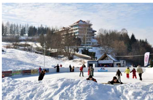
Zimą - lodowisko

Takie rozwiązanie jest idealne ze względu na charakter i sezonowość uprawianych sportów. Przede wszystkim zostanie urozmaicona oferta turystyczna na lato i zimę przy mniejszych nakładach finansowych. Dodatkowo urządzenia ze SkateParku będą mniej narażone na dewastację siły natury poprzez zimowe składowanie.