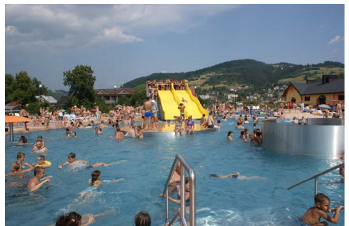
Kompleks basenów w Muszynie