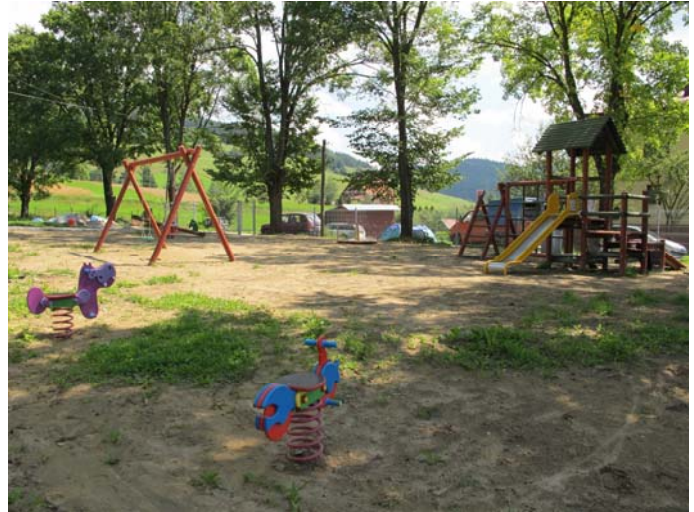
Plac zabaw w Jastrzębiku