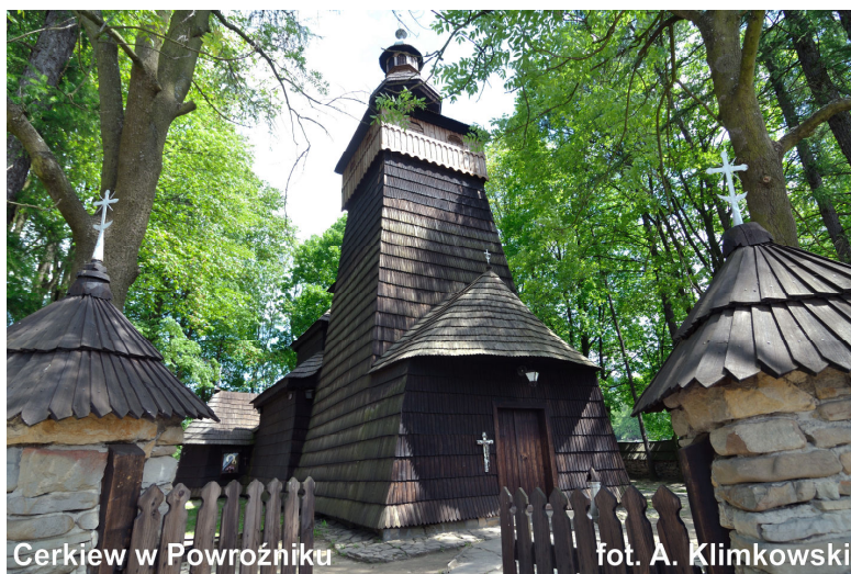
Cerkiew w Powroźniku