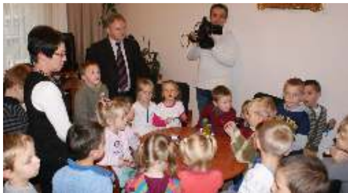
Wizyta 6-latków w Urzędzie Miasta i Gminy Uzdrawiskowej Muszyna

pytań dla 6-latków np. kto chciałby mieć taką pracę jak on? Ku jego zdziwieniu ochotników do zostania Burmistrzem było znacznie więcej niż do piastowania stanowiska radnego. Później każdy chętny do wcielenia się w rolę Burmistrza mógł usiąść na jego fotelu i udzielać odpowiedzi dla kolegów i koleżanek, którzy jako mieszkańcy mieli wiele spraw do załatwienia z Panem lub Panią „Burmistrz”. Kto wie może, to właśnie od tych młodych ludzi za kilkanaście lat będzie zależał dalszy rozwój Muszyny? Wydarzeniu towarzyszył mini występ artystyczny oraz uroczyste wręczenie pamiątkowych plakatów przygotowanych przez przedszkolaki z okazji wizyty w urzędzie. Nie zabrakło