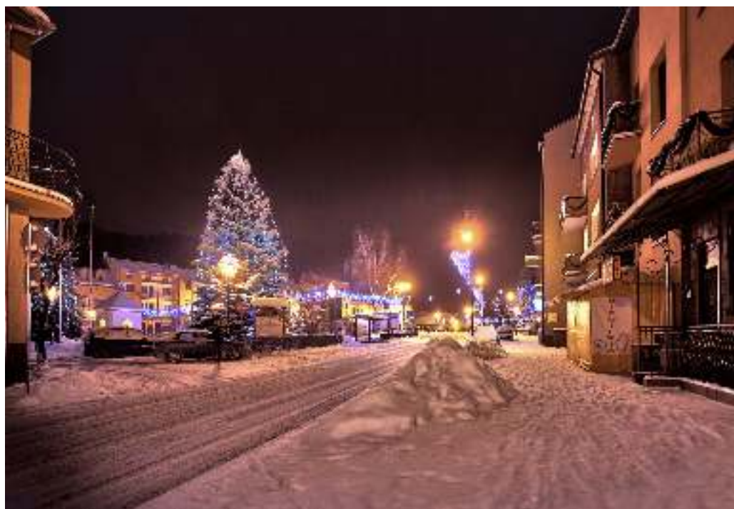
Iluminacja świetlna muszyńskiego rynku

Z bliża się koniec roku oraz okres świąteczno-noworoczny w związku z tym pragnę zachęcić Państwa do udziału w kolejnej edycji konkursu najpiękniejsza posesja w zimie. Organizowany od kilku lat konkurs jest znakomitą okazją do ciekawego udekorowania posesji aby uzupełnić świąteczny wystrój naszego miasta i gminy. Władze Muszyny od wielu lat inwestują w coraz bogatsze i atrakcyjniejsze oświetlenie świąteczno-noworoczne na terenie miasta i gminy, jako formę uatrakcyjnienia zimowego wyglądu gminy. Figurka aniołka i podświe-