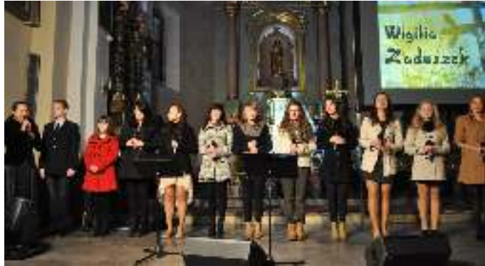
Koncert „Wigilia Zaduszek”

Początek listopada to czas szczególnej pamięci o naszych zmarłych bliskich, ale także o tych którzy walczyli o wolną i niepodległą Ojczyznę. W 95 Rocznicę Odzyskania przez Polskę Niepodległości 11 listopada tego roku w kościele pod wezwaniem św. Józefa Oblubieńca NMP w Muszynie-