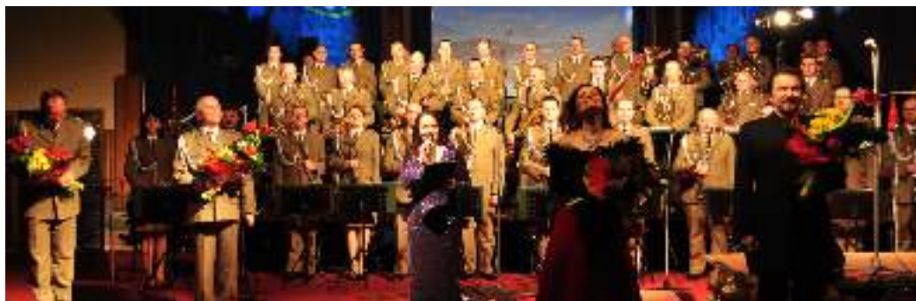
Reprezentacyjna Orkiestra Straży Granicznej z Nowego Sącza

Mamy nadzieję, że najbliższe wydarzenia artystyczne przyniosą Państwu wiele miłych wrażeń i sprawią dużo radości. O kolejnych ciekawych przedsięwzięciach będziemy informować za pośrednictwem stron internetowych dlatego prosimy abyście odwiedzali je często: www.muszyna.pl , www.mgok.muszyna.pl , www.muszyna.tv