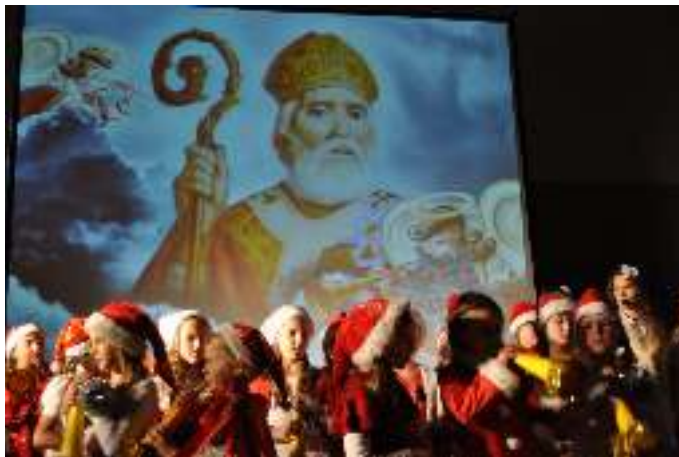
Spotkanie ze św. Mikołajem w Muszynie

Adwent (łac. adventus – przyście) – czas oczekiwania, który rozpoczyna przygotowanie duchowe do przyjścia nowonarodzonego Zbawiciela. Tradycją w Kościele katolickim są odprawiane w tym okresie msze, zwane roratami ku czci Najświętszej Marii Panny, na pamiątkę przybycia Archanioła Gabriela, zwiastującego, iż zostanie Matką Syna Bożego. Mieszkańcy Muszyny tak jak i przed wielu laty tak i teraz spieszą o świcie do kościoła na roraty z modlitwą i pokutą aby przygotować serce na Boże Narodzenie. Dzieci niosą ze sobą zapalone lampiony – światło, które jest symbolem Chrystusa. Ta piękna w swej wymowie symbolika ma przypominać nie tylko dzieciom, o konieczności zbierania przez cały adwent dobrych uczynków, które rozjaśnia mroki grzechu w naszej duszy a tym samym wskażą Chrystusowi drogę do