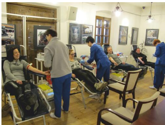
XI Akcja krwiodawstwa w Muszynie

Z a nami kolejna, edycja akcji poboru krwi w Muszynie i z pewnością można zaliczyć ją do udanych. Chętnych do podzielenia się tym życiodajnym płynem jakim jest krew nie brakowało. W niedzielę (23.02.2014 r.) do Muzeum przy ul. Krzywej gdzie tradycyjnie organizowany jest pobór przez cały dzień przybywało osób skorych do niesienia pomocy innym. W sumie zgłosiło się aż 38 wolontariuszy. Niestety nie każdy mógł oddać krew, której ostatecznie udało się pobrać 13 litrów i 50 ml. Jak widać na przykładzie Muszyny i innych miejscowości, które coraz chętniej organizują tego typu przedsięwzięcia starania Oddziału Terenowego Regionalnego Centrum Krwiodawstwa i Krwiolęcznictwa