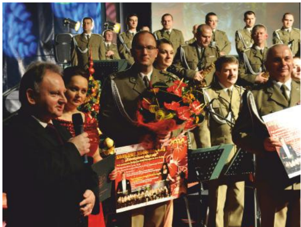
Koncert Noworoczny w wiedeńskim stylu

były ponadczasowe przeboje takie jak: „Jakże mam ci wytłumaczyć z operetki” „Księżniczka Czardasza, „O sole Mio” Ediego Caupa czy „Libiamo Ne`lieti calici”.