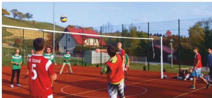
„Orlik” w Szczawniku

osobach ma możliwość sprawdzenia swojej kondycji na jakże już znanych i chętnie uczęszczanych siłowniach plenerowych, które znajdują się w ogrodach sensorycznych w dzielnicy „Zapoprządzie”, wzdłuż potoczku Szczawnik, w Parku Baszta oraz niedawno otwartej nowej siłowni na świeżym powietrzu w Miliku. Młodzież może korzystać z wielu boisk wielofunkcyjnych, które znajdują się w większości sołectw. Na terenie gminy znajdują się także dwa profesjonalne boiska „Orlik”, których dokładne harmonogramy godzin otwarcia znajdują się na stronie internetowej www.muszyna.pl . Gmina posiada także szczególnie