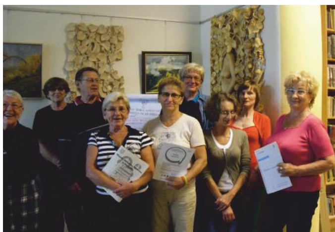
Uczestnicy projektu „O finansach w bibliotece”