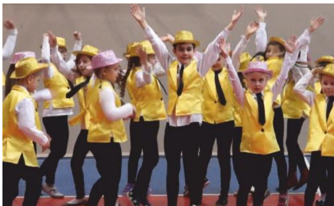
I Maraton Tańca Nowoczesnego

12 marca w środę w muzyńskim muzeum odbył się koncert pt. „Współczesna