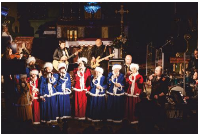
„Muszyńskie kolędowanie”

Impreza zrealizowana została w ramach projektu MuLuDu i współfinansowana była ze środków Unii