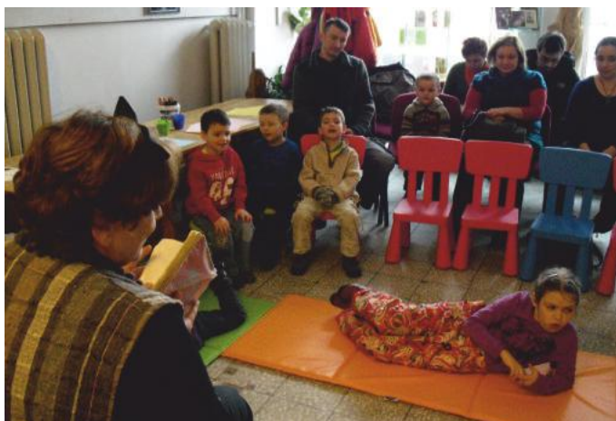
Popołudniowe czytanki

walory płynące z głośnego czytania i wpływu na jego rozwój intelektualny, uwrażliwienie dzieci na muzykę poważną, stymulowanie u dzieci rozwoju poznawczego, emocjonalnego i motorycznego. Projekt został podzielony na trzy bloki tematyczne: Muzyczna Godzina, Książkowa Godzina, Filmowa Godzina . Do projektu zaproszeni byli specjaliści z dziedziny muzyki, plastyki, pedagogiki. Od maja do września biblioteki realizowały program Narodowego Banku Polskiego i Fundacji Rozwoju Społeczeństwa Informacyjnego pt. „ O finansach... w bibliotece ”. Przedsięwzięcie skierowane było do mieszkańców – seniorów naszej gminy. Projekt dotyczył zarządzania budżetem domowym, przeliczania walut, wyboru banku, zakładania lokat, przelewów przez Internet, wyliczania rat, ubezpieczenia mieszkań, oszczędzania, zakupów przez Internet,