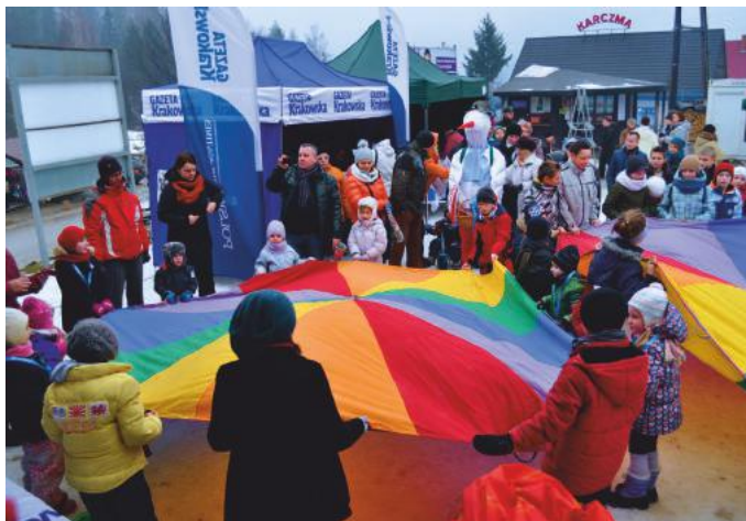
Zimowe Pejzaże Pogranicza

Impreza zrealizowana została w ramach projektu MuLuDu i współfinansowana była ze środków Unii Europejskiej z Europejskiej