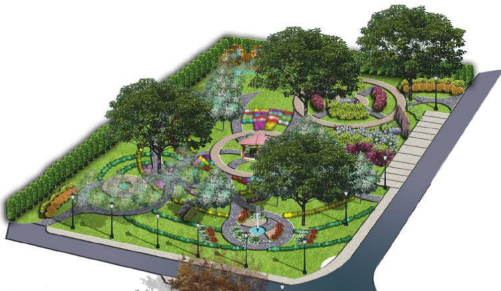
Wizualizacja zagospodarowania centrum Powroźnika