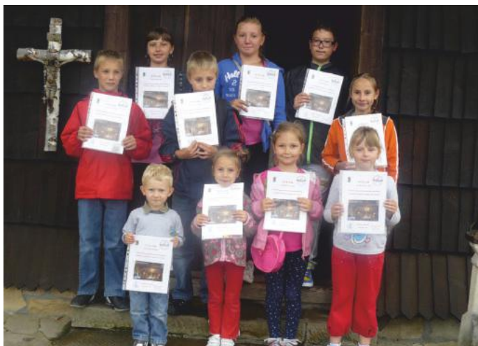
Uczestnicy projektu „Cudze chwalicie, swego nie znacie”

seniorów, którzy otrzymali certyfikaty ukończenia kursu. Lipiec i sierpień to dla bibliotek gorący czas pełen pracy z dziećmi i młodzieżą. Biblioteki wyszły z propozycjami różnorodnych zajęć, spotkań i warsztatów artystycznych i edukacyjnych. Biblioteka w Powroźniku zorganizowała cykl zajęć edukacyjnych pt. „Cudze chwalicie, swego nie znacie” , których tematem była zabytkowa cerkiew w Powroźniku wpisana na listę Światowego Dziedzictwa Kulturowego i Przyrodniczego Ludzkości UNESCO. Raz w tygodniu dzieci odwiedzały cerkiew, aby poznać jej historię, dowiedzieć się czym różnią się ikony od obrazów, co to jest ikonostas, carskie wrota, ambona, gont. W czasie prelekcji organizowane były konkursy: plastyczny - „Cerkiew oczami dziecka” i edukacyjny - „Jakie warzywo przypomina kopuła wieży?” . Na zakończenie wszyscy otrzymali pamiątkowe dyplomy uczestnictwa i wpisali się do księgi pamiątkowej. Biblioteka w Żegiestowie w czasie zajęć wakacyjnych, tym razem, położyła nacisk