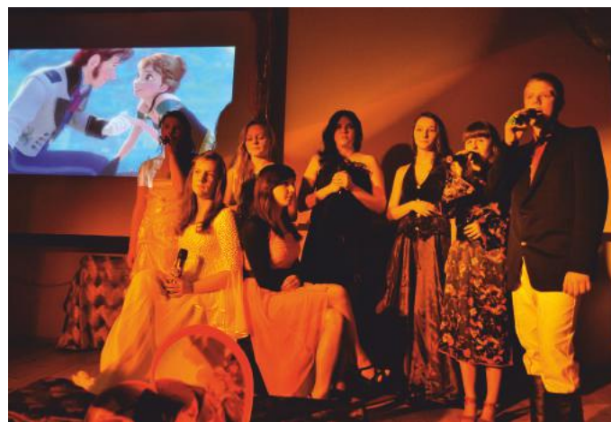
Miłość w poezji i muzyce

14 lutego w „Dzień Zakochanych” Miejsko-Gminny Ośrodek Kultury w Muszynie zorganizował koncert pt. „Miłość w poezji i muzyce”, który odbył się w muzyńskim muzeum. Podczas koncertu zaśpiewano najpiękniejsze piosenki o miłości pochodzące ze światowych produkcji Walta Disneya. Muzyczne prezentacje przeplatały się z poezją o miłości polskich i słowackich poetów.