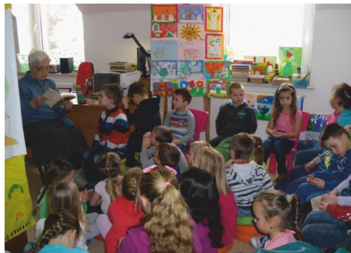
Zajęcia prowadzone w bibliotece w Żegiestowie