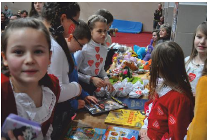
Wielka Orkiestra Świątecznej Pomocy 2014

Europejskiej z Europejskiego Funduszu Rozwoju Regionalnego w ramach Programu Współpracy Transgranicznej Rzeczpospolita Polska - Republika Słowacka 2007-2013.