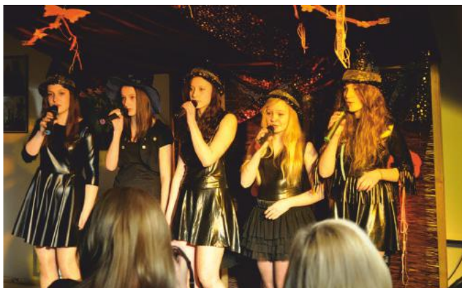
„Współczesna kobieta pogranicza”

której dzieci ozdabiały domki z piernika słodkim lukrem, rozgrywki tenisa stołowego i konkurs piosenki w Szczawniku oraz wiele innych o których informowaliśmy Państwa za pośrednictwem Telewizji Muszyna a także na stronach internetowych miasta. Organizatorem programu na ferie w roku 2014 był Burmistrz Muszyny oraz Miejsko-Gminny Ośrodek Kultury w Muszynie. Dziękujemy za tak liczne uczestnictwo w tych wydarzeniach, mamy nadzieję, że dzięki nim