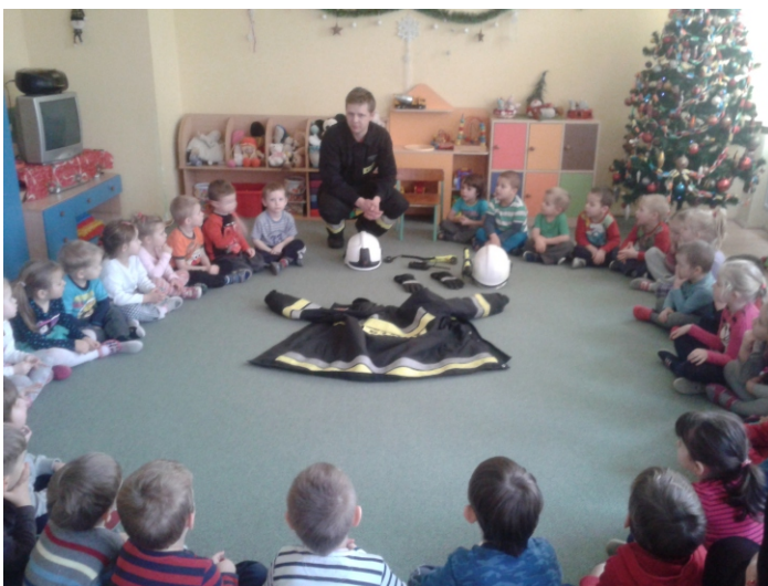
Spotkanie w ramach projektu „Dbaj o przyrodę, oszczędzaj wodę”

P o raz kolejny Zespół Szkolno-Przedszkolny w Muszynie realizuje projekty współfinansowane przez Fundusz Partnerstwa Kropli Beskidu. W bieżącym roku szkolnym realizujemy projekt „Dbaj o przyrodę, zakręcaj wodę”. W ramach projektu zmodernizowano infrastrukturę wodną w budynku szkoły (wymiana baterii umywalkowych i prysznicowych), systematycznie monitorowano zużycie wody oraz prowadzone były zajęcia edukacyjne mające na celu podniesienie poziomu świadomości ekologicznej i promowanie postaw prośrodowiskowych wśród uczniów, ich rodziców i nauczycieli. Projekt zakłada nie tylko poprawę oszczędności wody w budynku szkoły, ale również jest ciekawą porcją wiedzy kierowanej do uczniów i ich opiekunów. Natomiast Przedszkole w Muszynie realizuje projekt współfinansowany przez Fundusz Partnerstwa Kropli Beskidu pod nazwą „Dbaj o przyrodę,