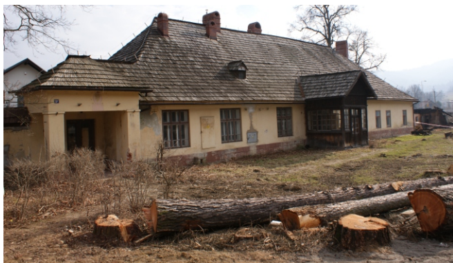
Dwór starostów przed remontem