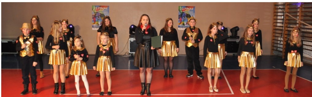
Wielka Orkiestra Świątecznej Pomocy w Muszynie

Przedszkolnym w Muszynie rozpoczął się program artystyczny, podczas którego wystąpiły zespoły działające przy Miejsko-Gminnym Ośrodku Kultury w Muszynie. Podczas wieczornej imprezy na przybyłych czekał także kiermasz słodkich wypieków, a wśród przysmaków nie zabrakło lukrowanych serduszek piernikowych oraz czekoladowych języków upieczonych przez panie ze świetlic wiejskich z Jastrzębika, Andrzejówki oraz Koła Aktywnych Kobiet z Żegiestowa. Dla wszystkich uczestników spotkania przygotowano quiz pn. „Kto da więcej”. Podczas tej zabawy można było nabyć gadżety WOŚP, aniołki szydełkowe oraz wiele innych ciekawych przedmiotów przekazanych na ten szczytny cel przez ludzi wielkiego serca. Ogromnym zainteresowaniem w tym roku cieszyły się krawaty przekazane przez dyrektora ZSP w Muszynie, które stanowią rodzaj przywileju uczniowskiego. Jeśli uczeń przyjdzie do szkoły w krawacie, nie zostanie w tym dniu wezwany do odpowiedzi, a tym samym uniknie słabej oceny. Oryginalny pomysł, który sprawił wszystkim wiele radości spodobał się zarówno dzieciom, młodzieży jak i rodzicom uczniów tej szkoły.