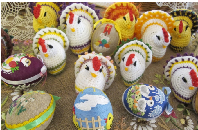
Pokaz tradycyjnych ozdób w Muszynie