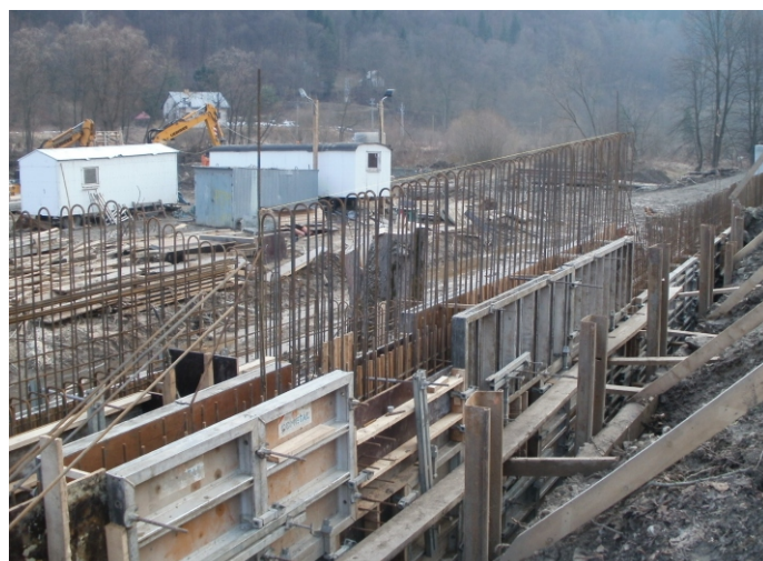
Plac budowy kładki Żegiestów-Sulin