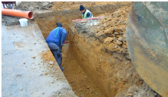
Prace przy budowie sieci wodociągowej i kanalizacyjnej