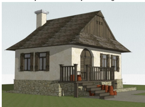
Dom garncarza