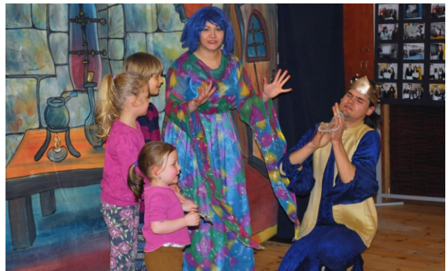
Spektakl dla dzieci podczas ferii

raz pierwszy w czasie ferii zostały zorganizowane kreatywne warsztaty rękodzielnicze pt. „Wykonujemy ozdoby z papieru” oraz „Artystycznie i plastycznie”, podczas których zarówno dzieci, młodzież, jak i dorośli mogli nauczyć