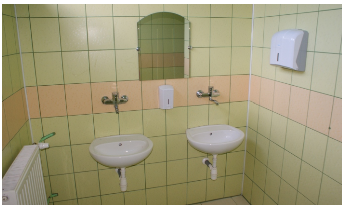
Wymienione w ramach projektu baterie łazienkowe w szkole

oszczędzaj wodę”. W ramach infrastruktury wodną w budynku Przedszkola