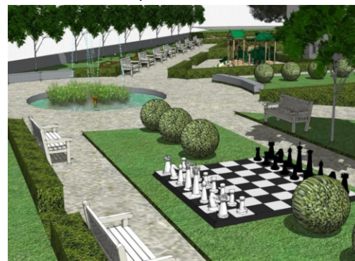
Szachy ogrodowe