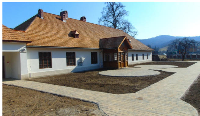
Dwór starostów po remoncie