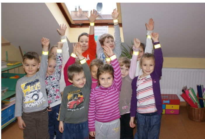
Dzieci z Muszyny z nowymi odblaskowymi gadżetami

Mając to na względzie Miasto i Gmina Uzdrowska Muszyna postanowiła wyposażyć każdego ucznia w uzdrowisku w odblasko-