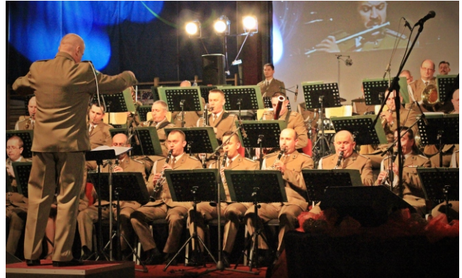
Koncert Noworoczny w Muszynie

Podczas tegorocznych ferii zimowych Miejsko-Gminny Ośrodek Kultury w Muszynie przygotował ofertę dla dzieci, młodzieży a także dorosłych. Pośród atrakcyjnych propozycji dla najmłodszych znalazły się