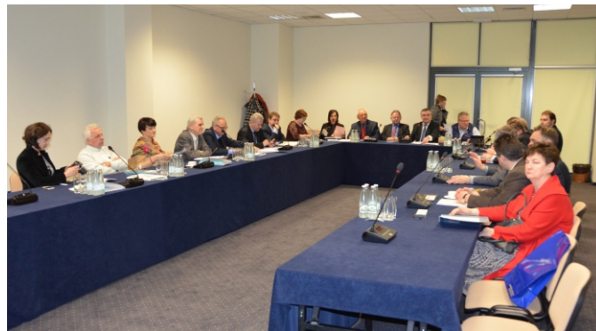
Walne zgromadzenie członków SGU RP

Jak wynika z treści komentarzy zamieszczanych przez internautów na