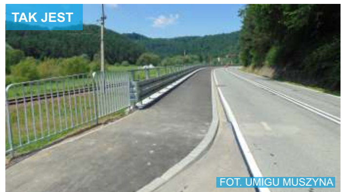
Andrzejówka tereny rekreacyjne i ścieżka rowerowa EuroVelo 11 wartość projektu: 8 637 772 zł