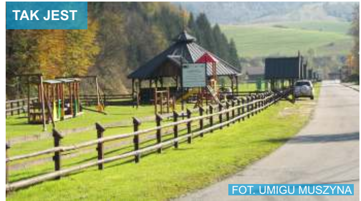
Milik – teren rekreacyjny, chodnik wartość projektów: 6 037 927 zł