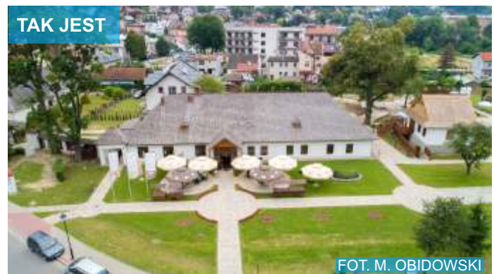
Remont Dworu Starostów - obecnie siedziba Ośrodka Kultury wartość projektu: 2 536 182 zł