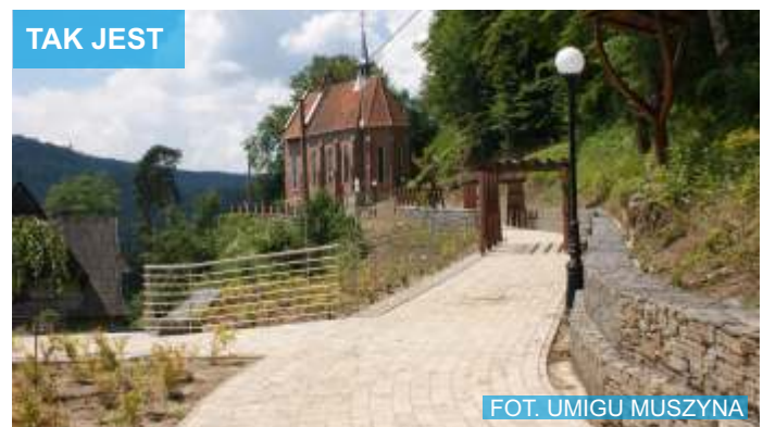
Deptak w Żegiestowie wartość projektu: 3 722 199 zł